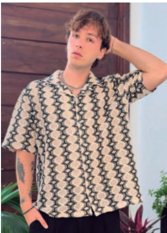
EN TIK TOK E INSTAGRAM @silva_agus

Planchar la ropa: “Cuando ves a alguien con la ropa arrugada, transmite que ni le importó cómo se ve”.